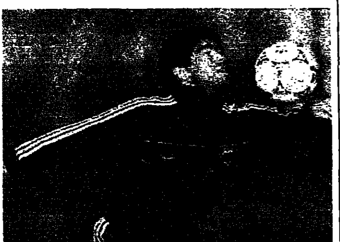
مارادونا يلعب الكرة بيده وتخرج الا يسجل الاهداف بواسطتها